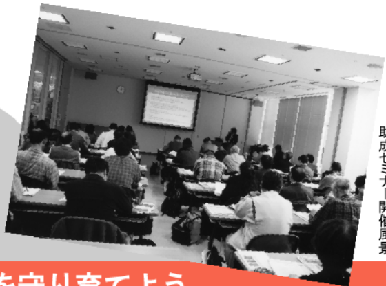
2004年環境市民活動 助成セミナー開催風景