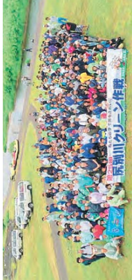
河川敷を清掃する地上班とカヌー・ラフティングポイントを使用して川を清掃する班に分かれて活動を行い、2トントラック2台のごみを収集。(NPO法人しほりネットワーク)