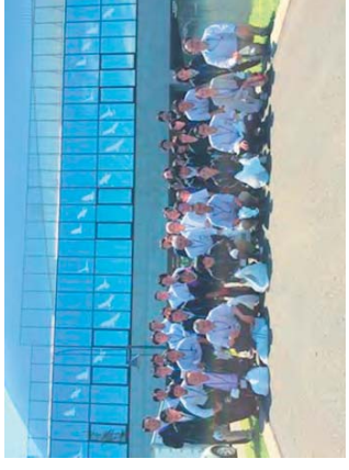
札幌ドーム周辺エリアの清掃活動。晴天にも恵まれ、8年目も無事終了しました。(株札幌ドーム)