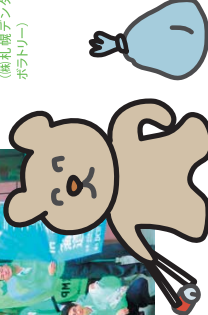
秋のハロウィンのごみと2班に分かれて清掃しました。1時間半ほどの活動にて7つのビニール袋が回収されました。(八雲山見見)