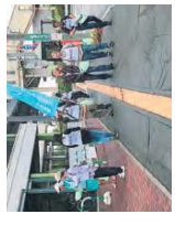
一人あたりのプラスチックごみの発生量が世界初の日本、残念ながら、街中にもレジ袋のごみが一番多かった。少年なども活動に参加した人はレジ袋削減を積極的にすすめると思います！！(NEC通信システム)