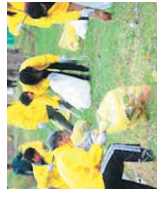
側溝のごみ拾いをおこない、いよいよこのごみ袋や大型ごみなどを道徳の間に添えてお集まりトラックが回収しました。(江別工業団地協同組合)