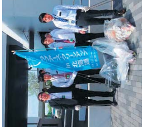
秋季清掃活動は2回に分けて実施しました。暑さが残っている中、お疲れはでした。(札幌市東区)ポラリス