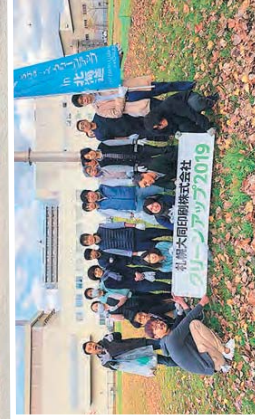
橋の下は隠しやすいのがごみが多い／人通りの多いところはやっぱりたばこ／枯葉にごみが隠れて見つけれなかった。焼き手したくなくた／日々、身元とごみから身を遠ざけることが大切だと思います。(札幌大同印刷 厚別本社・豊平営業所)