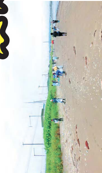
稚内空港から市内に向かう途中で最初に駅える海岸をきれいにしたいという目的で行っています。(山本建設)