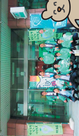
側溝のごみ拾いをおこない、いよいよこのごみ袋や大型ごみなどを道徳の間に添えてお集まりトラックが回収しました。(江別工業団地協同組合)