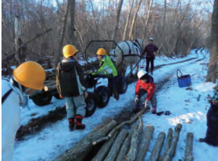
写真は H26 年度報告会の発表団体の活動風景です