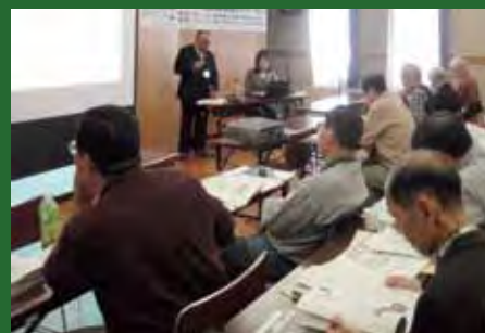
毎年好評の「全国北海道の助成制度一覧」 2012 年度版も会場で配布します

Ustream (インターネット) によるライブ配信を行います。 詳細はHP「きたネットWeb」「きたネットTV」でご確認ください。